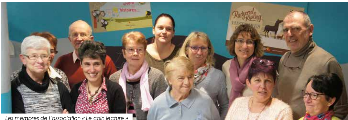
Les membres de l'association « Le coin lecture »