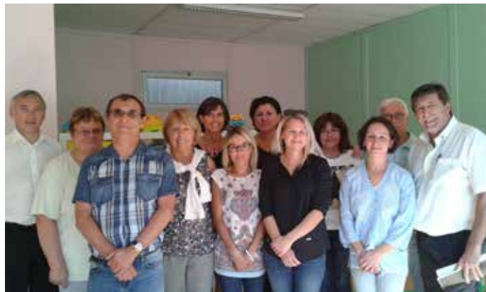
Inauguration de la MAM

D'autres opportunités verront le jour avec l'aménagement d'un appartement dédié à la petite enfance dans la future résidence seniors à l'horizon 2017 / 2018.