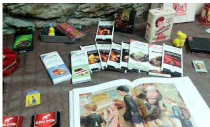
L'exposition sur le chocolat