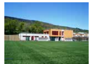
Le nouveau complexe sportif des Etournelles