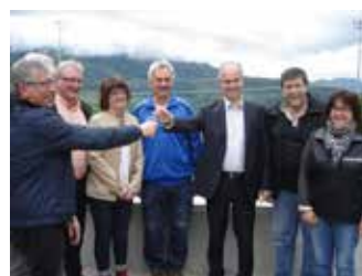
Remise des clés au Valserine Football-Club