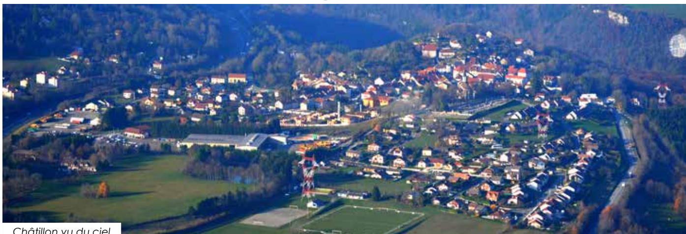
Châtillon vu du ciel