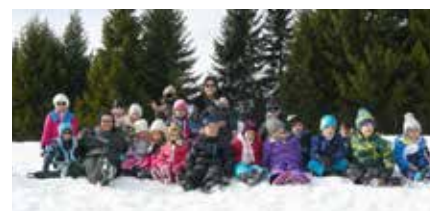
Sortie neige à l'accueil de loisirs

Pendant les vacances scolaires la bibliothèque est ouverte les mercredis et vendredis aux heures habituelles. Consultez et réservez les ouvrages disponibles sur www.lecture.ain.fr