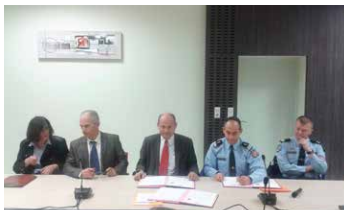
de gauche à droite : Mme la Sous-préfète, Monsieur le Maire, Monsieur le Préfet et 2 gendarmes

Actée par la signature d'une convention, à Châtillon-en-Michaille le 19 janvier 2016, entre le Maire, le Préfet et le Commandant du Groupement Départemental de Gendarmerie, cette action mobilise une douzaine de personnes sur toute l'étendue du territoire communal. Merci à eux pour cette implication civique.