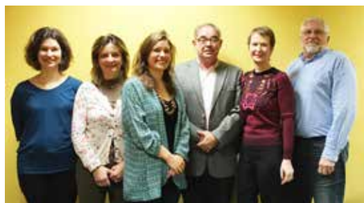
L'équipe d'encadrement du réseau Mnémosis

Toutes informations auprès du CLIC du Pays Bellegardien 5, rue des Papetiers 01200 - Bellegarde tél. : 04 50 48 71 64 ou directement auprès du réseau Mnémosis tél 04 50 20 15 15.