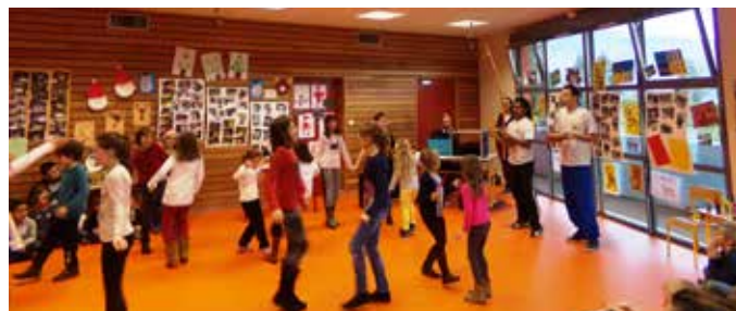
Le groupe de Capoeira lors du spectacle de Noël

trimestres de cette année scolaire. Après sondage, 79% des parents disent être très satisfaits du contenu des activités proposées, les retours sont positifs et la communication avec les familles constructive. Lors de leurs spectacles, les enfants ont témoigné leur enthousiasme à découvrir et pratiquer et de nouvelles activités.